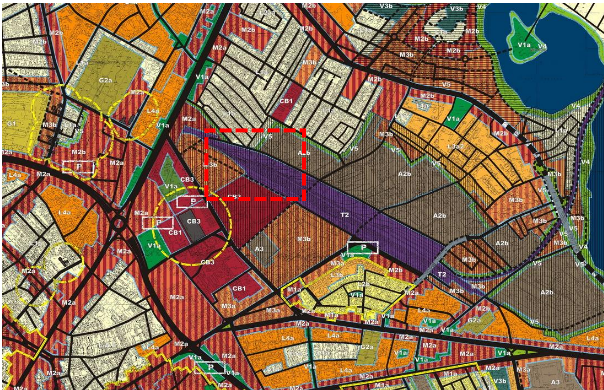
Extras din P.U.Z. Sector , aprobat prin HCL nr 99/2003, în prezent expirat